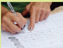
Han reunido 3,800 firmas.

La dirigente expresó que ha sido objeto de seguimientos y hostigamientos por parte de personas no identificadas, lo cual interpreta como una estrategia para intimidar a quienes apoyan el proceso de revocatoria.