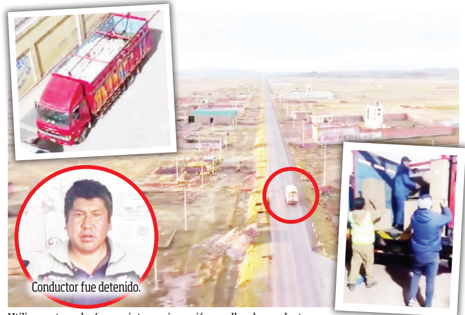
Utilizaron tecnología para intervenir camión que llevaba productos.

La intervención de la mercadería, que carecía de documentación legal que formalice su traslado, se efectuó a la altura del centro poblado de Ayabacas, tras conocerse que el camión en el que