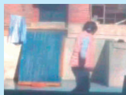
Multa sería una UIT.

→ Arequipa. Funcionarios de José Luis Bustamante y Rivero visitaron la vivienda donde se reportó un caso de maltrato animal el fin de semana pasado.