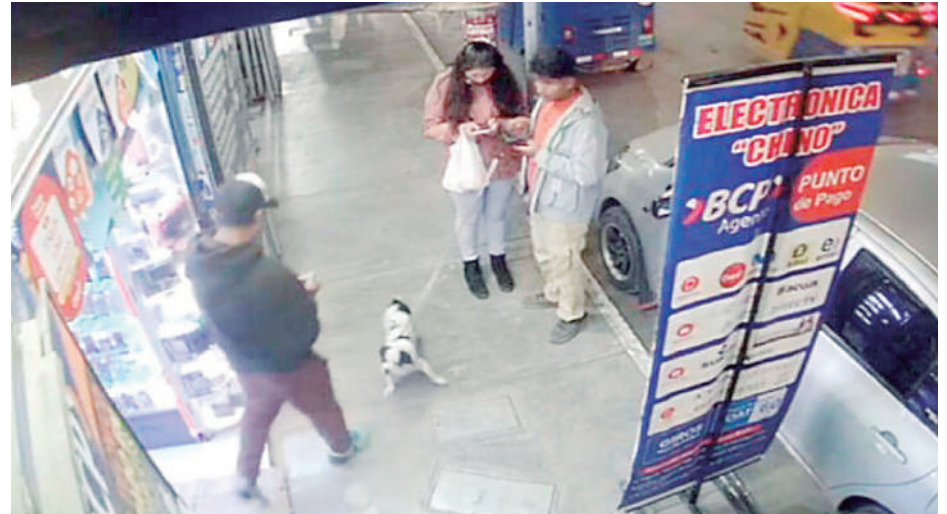
La detención fue lograda gracias a las cámaras de seguridad del agente donde retiró el dinero.