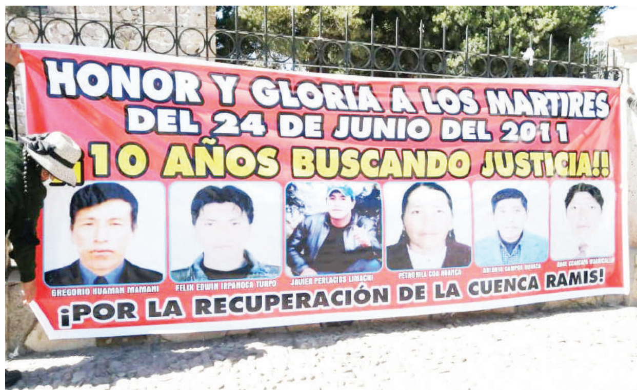
Deudos llevan años solicitando justicia para sus seres queridos y una sanción ejemplar para los asesinos.