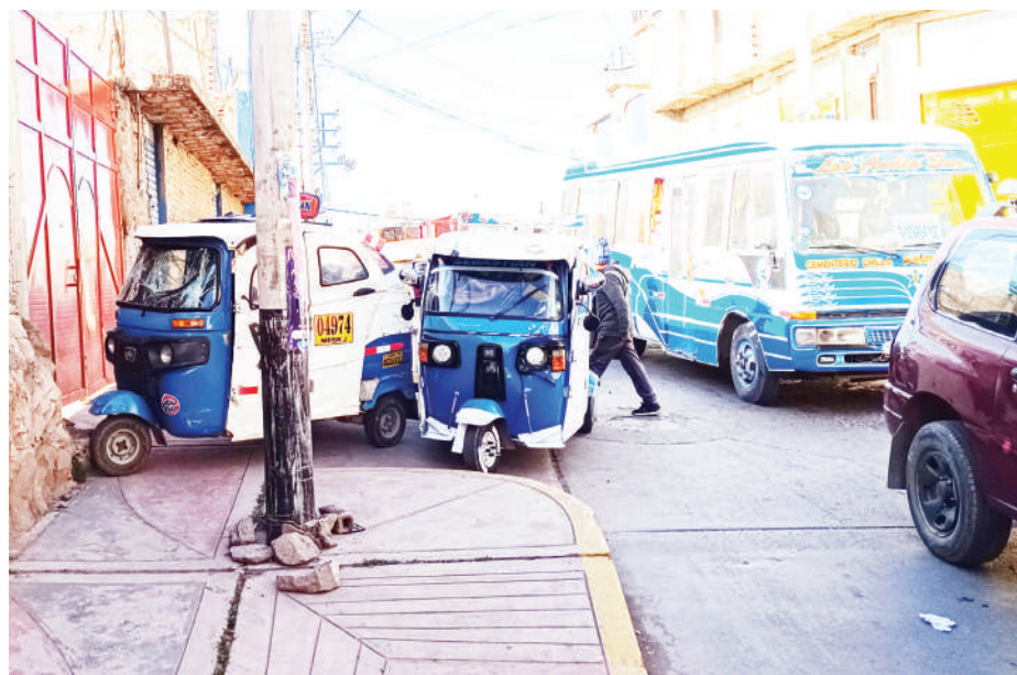
Tráfico en la zona genera problemas de tránsito que muchas veces terminan así.

La colisión generó daños, además de en las unidades vehiculares, en la puerta metálica de