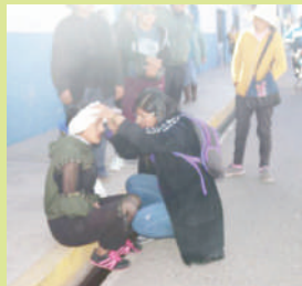
Ayudaron a fémina.

Tras ser auxiliada por los transeúntes, fue trasladada por la ambulancia SAMU hasta el hospital Car-