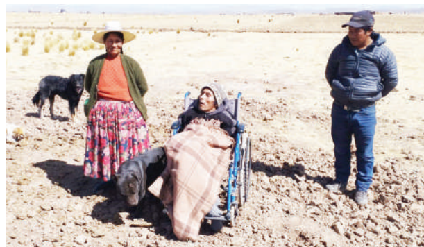
Sexagenaria pide justicia a las autoridades.

La acción tuvo lugar el jueves pasado, cuando los comuneros de Suches ingresaron a su predio, demolieron su vivienda y cavaron zanjas. Los comuneros argumentan que el terreno será utilizado para la construcción de una planta lechera.