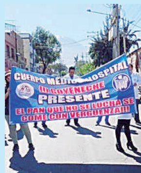
Se unen a protesta nacional

Dicha medida tomada por los profesionales de la salud se debería al bajo presupuesto asignado al sector Salud y el desabastecimiento