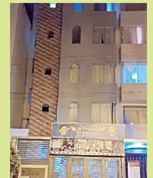
Deja hijos en orfandad

urbanización Los Ángeles del Cercdo de Arequipa. Cabe mencionar que el trabajador no contaba con los equipos de seguridad. Al lugar de los hechos llegaron personal de rescate y los peritos de Criminalística de la División de Investigación Criminal (Divincri) para realizar el levantamiento del cuerpo.