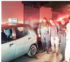
Intentaron darse a la fuga.

→ Arequipa. Agentes de la Unidad de Emergencia detuvieron a tres miembros de la banda criminal conocida como 'Los Pitufos de Villa Unión', quienes fueron acusados de robar un vehículo y arrastrar a la propietaria al ser descubiertos.