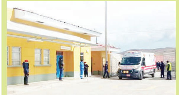
Extraen quiste hidatídico pulmonar a menor.

→ Carabaya. Una intervención quirúrgica de alta complejidad denominada "Lobectomía inferior derecha" (extracción del lóbulo inferior derecho contenido con quiste hidatídico), por medio de un abordaje axilar mínimo, se realizó en el hospital San Martín de Porres de Macusani.