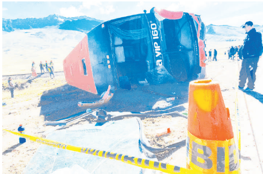
Despiste en la provincia de Melgar cobró la vida de once personas.

De ese total de accidentes, 174 consistieron en choques, 62 en atropellos y 29 en despistes vehiculares; en tanto, las causas de los accidentes son, la gran ma-