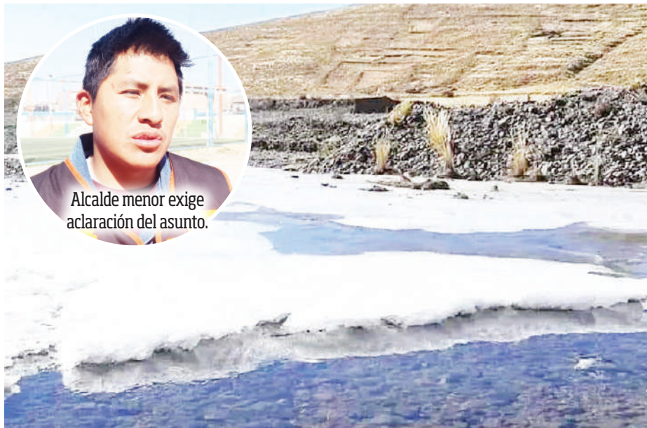
Alcalde menor exige aclaración del asunto.

Agregó que esta información la brinda el Servicio Nacional de Meteorología e Hidrología (Senamhi), mediante los