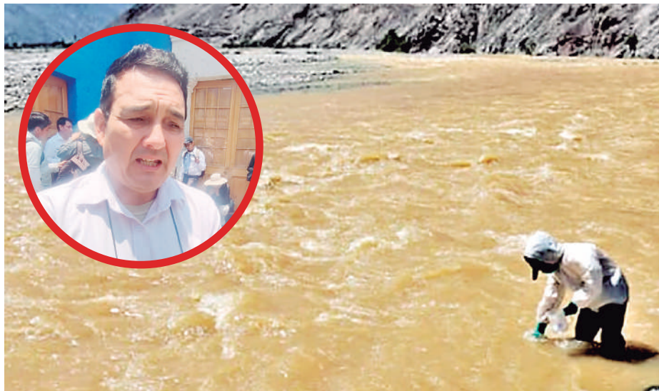
Autoridades se reunirán por contaminación en la cuenca del río Tambo que afecta a población.

rente indicó que en la reunión con la Presidencia del Consejo de Ministros (PCM) en coordinación con las autoridades de