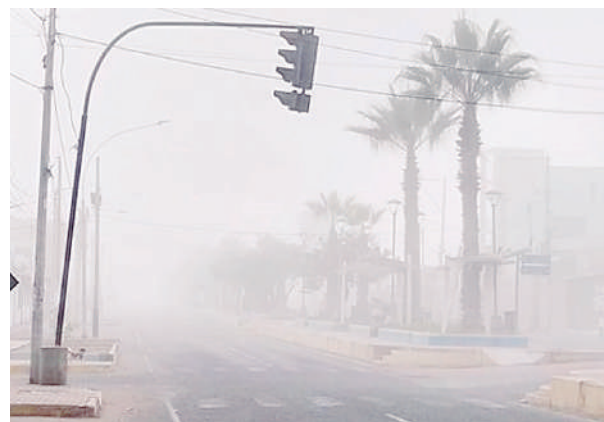
Temporal se vivirá entre hoy y mañana.

Los especialistas del Senamhi atribuyen estas condiciones a la