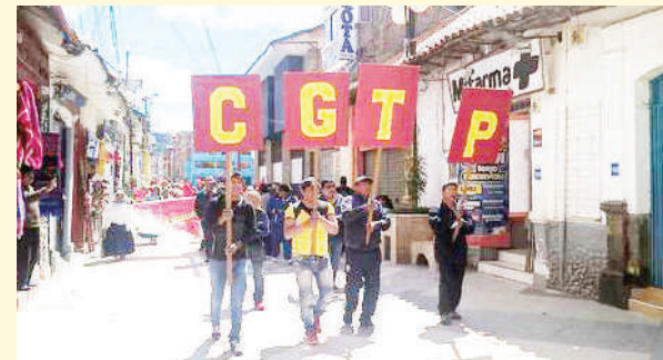
Anuncian protestas contra Dina Boluarte.