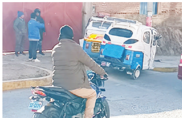
Felizmente no se reportaron heridos.