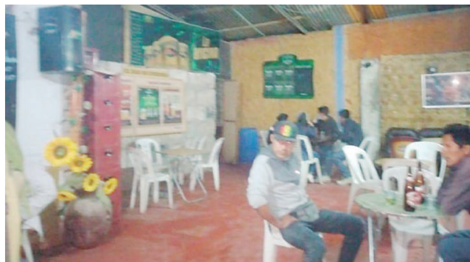
En el audio se menciona que otros locales sí habrían aceptado la oferta.

Durante la conversación, él le solicita un pago de S/ 4,400 para obtener la autorización como "restaurante", indicando que este dinero