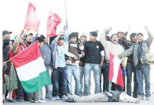
Represión contra manifestantes fue brutal.