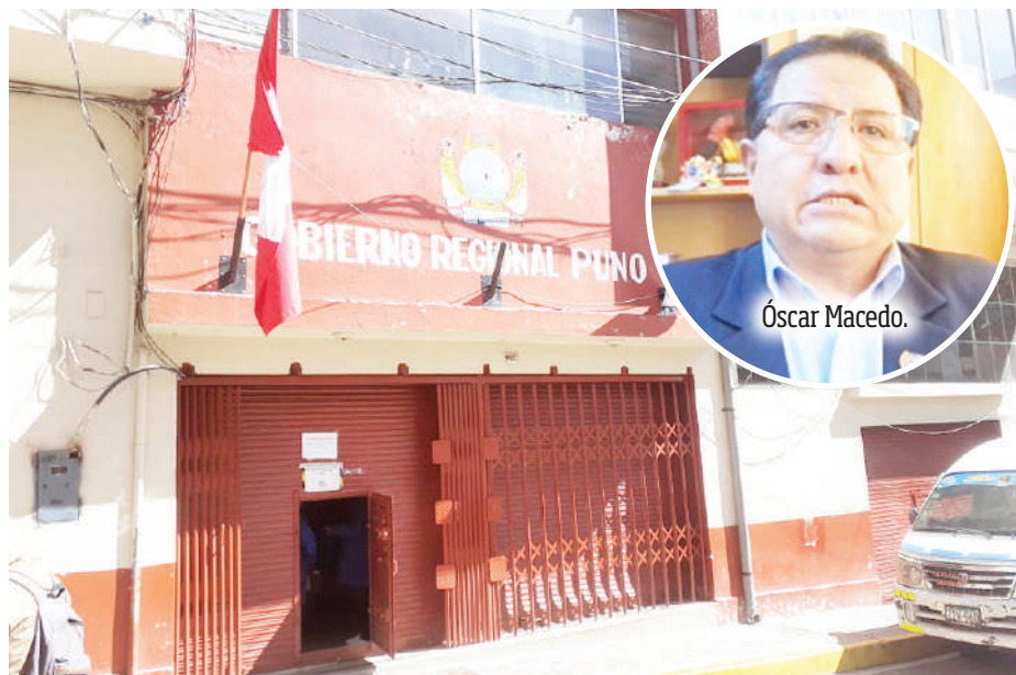
Autoridades del Gobierno Regional de Puno efectúan gestiones.

meses atrás, el consorcio inició un proceso judicial para evitar el desembolso de los S/ 33 millones, pero este fue desestimado.